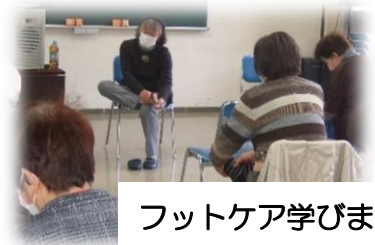
フットケア学びました